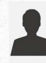
François PATTE HISTOIRE DES MATHÉMATIQUES